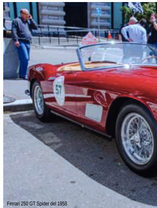
Ferrari 250 GT Spider del 1958